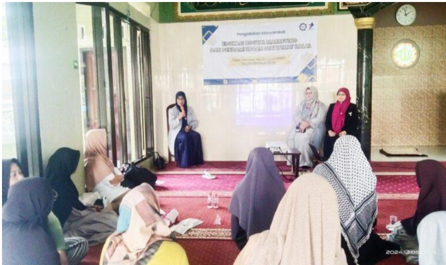
Gambar 2. Pemaparan Materi Strategi Pemasaran Digital dan Proses Produksi Halal

Dalam sesi memberikan penjelasan mendalam mengenai konsep pemasaran digital, pentingnya media sosial dalam menjangkau pasar yang lebih luas, serta bagaimana mengintegrasikan prinsip halal dalam strategi pemasaran.