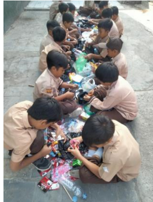
Gambar 2. Praktek Pembuatan Ecobrick

mengikuti kegiatan pembuatan Ecobrick yang dipandu oleh mahasiswa KKN. Siswa-siswi melakukan kegiatan sesuai arahan dengan seksama.