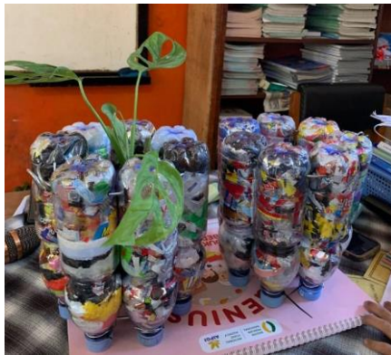
Gambar 3. Pot Bunga dari Ecobrick

Hasil pembuatan pot ecobrick dapat dilihat pada Gambar. 3. Setelah selesai pembuatan, pot dapat langsung digunakan untuk menanam tumbuhan yang diinginkan, kemudian pot dapat di simpan di taman sekolah atau didalam kelas sebagai hiasan agar suasana sekolah terlihat lebih indah.