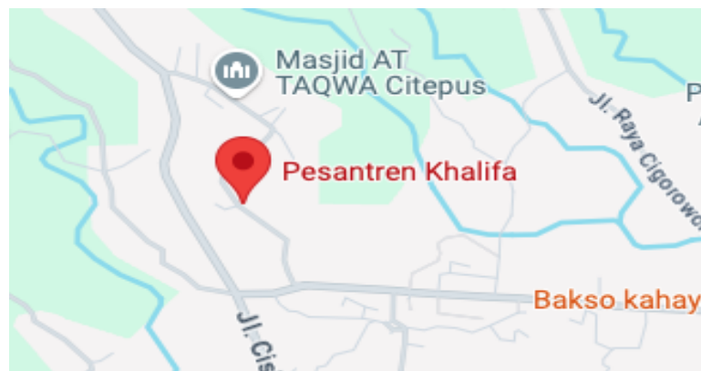
Gambar 1. Lokasi Tempat Pelaksanaan PKM

Kegiatan pengabdian ini diberi judul "Implementasi Strategi Pemasaran Digital untuk Pengembangan UMKM di Pesantren Khalifa: Pendekatan Halal dan Digitalisasi Pasar". Program ini bertujuan untuk memperkenalkan para pelaku UMKM pada konsep pemasaran digital yang mengintegrasikan prinsip halal dengan pemanfaatan teknologi digital. Diharapkan melalui pelatihan ini, para pelaku UMKM di Pesantren Khalifa dapat memanfaatkan media sosial dan platform digital lainnya untuk memasarkan produk mereka lebih luas, sambil tetap mempertahankan nilai-nilai agama yang terkandung dalam setiap produk yang mereka tawarkan.